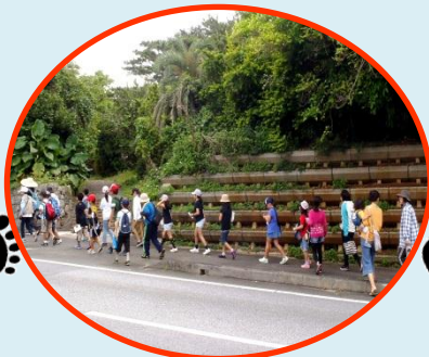
▲道は気をつけて渡ってね～