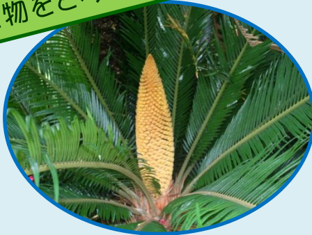
▲虫かごの材料 ソテツ