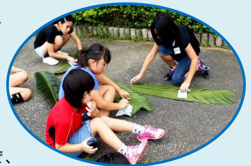
▲葉っぱのよごれをふきました

葉っぱの裏には、よごれや虫もたくさんついていたので、 それをぞうきんを使ってキレイにしました☆